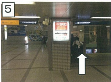
5 京阪 京橋片町口改札を出られて、ななめ右側に階段・エスカレーターがあります。