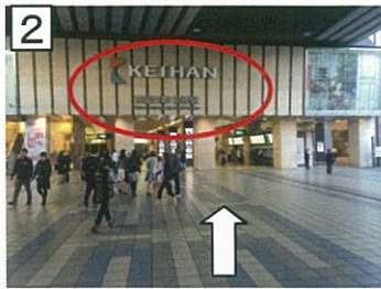
2 京阪電車改札方向へ進みます。