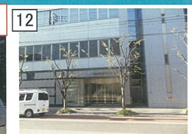
12 パルコープ(本部)到着です。(正面玄関です)