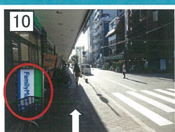
10 交差点から約50Mにあるファミリーマートを直進します。