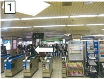
1 JR京橋駅北口改札を出られて左へ進みます。