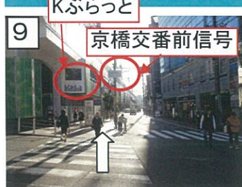
9 交差点を直進します。