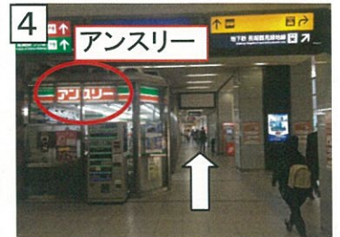
4 コンビニ(アンスリー)に沿って信号『京橋交番前』(下の写真⑨)まで直進します。(約100M)