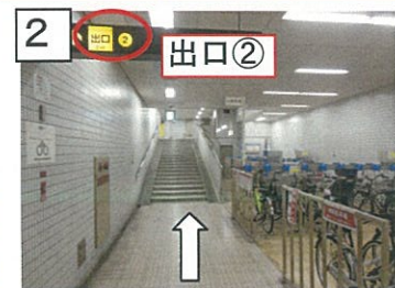
2 出口②から地上へ出ます。