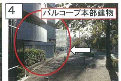
4 約50Mほどで左側にパルコープ本部建物(裏口)がありますので、建物に沿って正面へお廻り下さい。