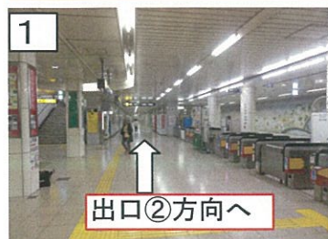
1 改札を出られて右へ出口②の方向へ進み、出口②まで直進します。(出口②まで約150M)