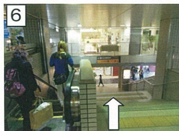
6 階段またはエスカレーター下ります。