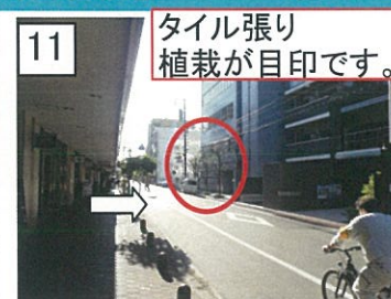
11 タイル張り植栽が目印です。 ファミリーマートを過ぎたあたりから、右側をご覧ください。となるとタイル張りの建物が見えます。(パルコープ本部です)