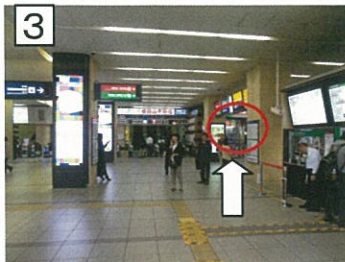
3 改札右側のコンビニ(アンスリー)方向へ。