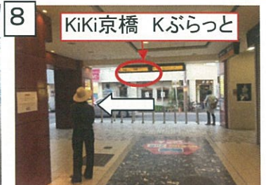
8 すぐの高架下歩道を左へ、信号『京橋交番前』(下の写真⑨)まで進みます。 ※信号『京橋交番前』まで約30M