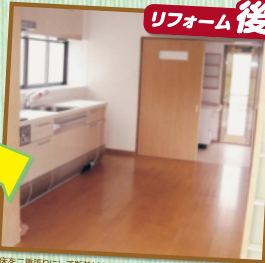
リビングの床にたわみがあり、底冷えもしていました。