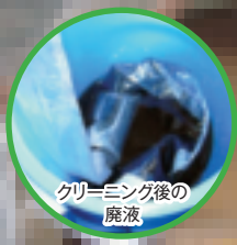
クリーニング後の廃液