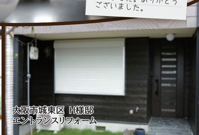
大阪市城東区 H様邸 エントランスリフォーム