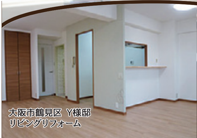
大阪市鶴見区 Y様邸 リビングリフォーム

担当して下さった方々も皆さんとても相談しやすく、親切に対応していただき結果として心から納得のいくリフォームになりました。ありがとうございました。