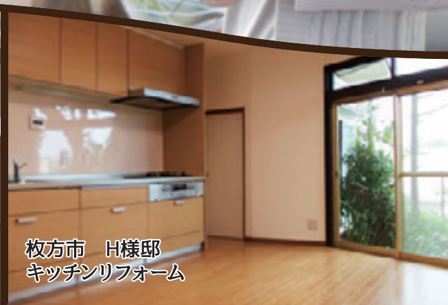
枚方市 H様邸 キッチンリフォーム