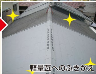
軽量瓦へのふきかえ