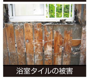
浴室タイルの被害