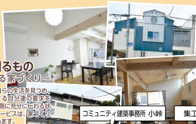
コミュニティ建築事務所 小峠

大切なことは、家を建てたい人が自らの生活を見つめ、その中から住まいのあり方に対する自分達の要求をしっかりと持ち、それが家をつくる側に十分に伝わる状況をつくることです。コープ住宅サービスは、家づくりに建築士の介在は不可欠と考えています。