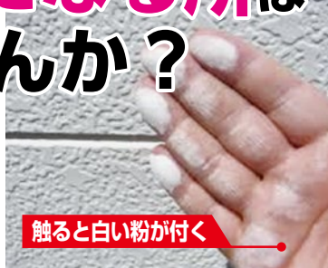
触ると白い粉が付く

サイディングはシーリングの劣化(切れ、硬化)に注意。モルタル壁等塗装面はチョーキング(壁を触ると白い粉が付着する現象)が出れば検討を。