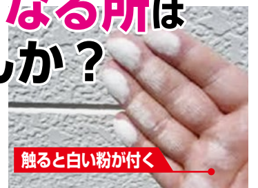
触ると白い粉が付く

サイディングはシーリングの劣化(切れ、硬化)に注意。モルタル壁等塗装面はチョーキング(壁を触ると白い粉が付着する現象)が出れば検討を。