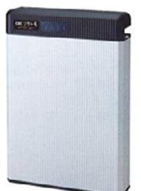
太陽電池モジュール ハイブリッドパワーコンディショナ DC/DC コンバータ 蓄電池ユニット