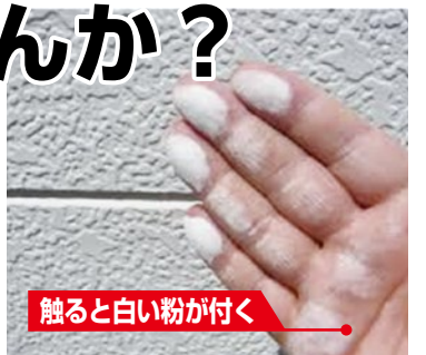
触ると白い粉が付く

サイディングはシーリングの劣化(切れ、硬化)に注意を。モルタル壁等塗装面はチョーキング(壁を触ると白い粉が付着する現象)が出れば検討を。