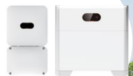
ハイブリッド蓄電システム

これから太陽光をお考えの方、以前に検討され、断念された方も大歓迎!ご自宅にお伺いして詳しく説明いたします。ご希望の方には、無料見積りも承ります。お気軽にご相談ください。