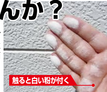
触ると白い粉が付く

サイディングはシーリングの劣化(切れ、硬化)に注意を。モルタル壁等塗装面はチョーキング(壁を触ると白い粉が付着する現象)が出れば検討を。