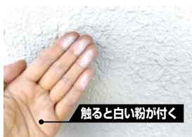
触ると白い粉が付く

モルタルの外壁のお住まいは、壁を触った時に白い粉がついたら塗り替えをお勧めいたします。